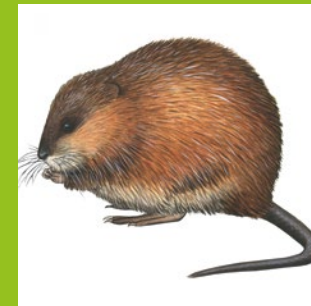
PLANCHE DE CLASSIFICATION